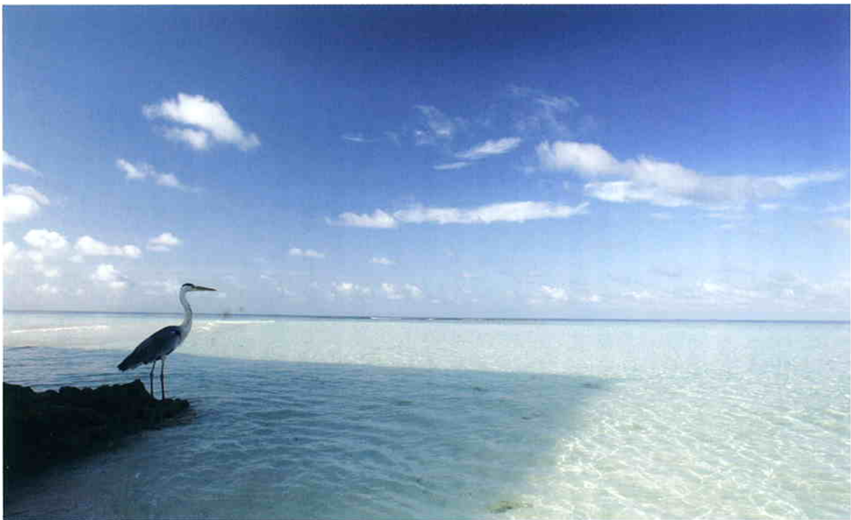
モルジブ