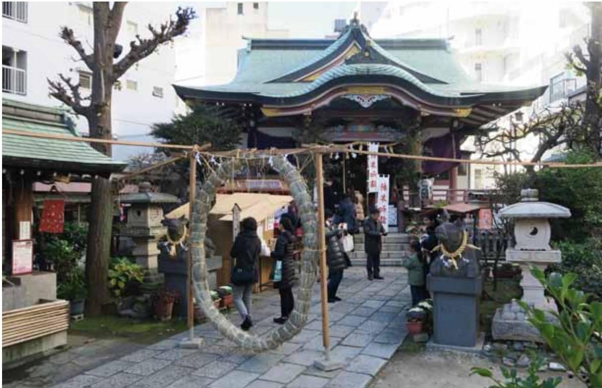
元旦の平川天満宮